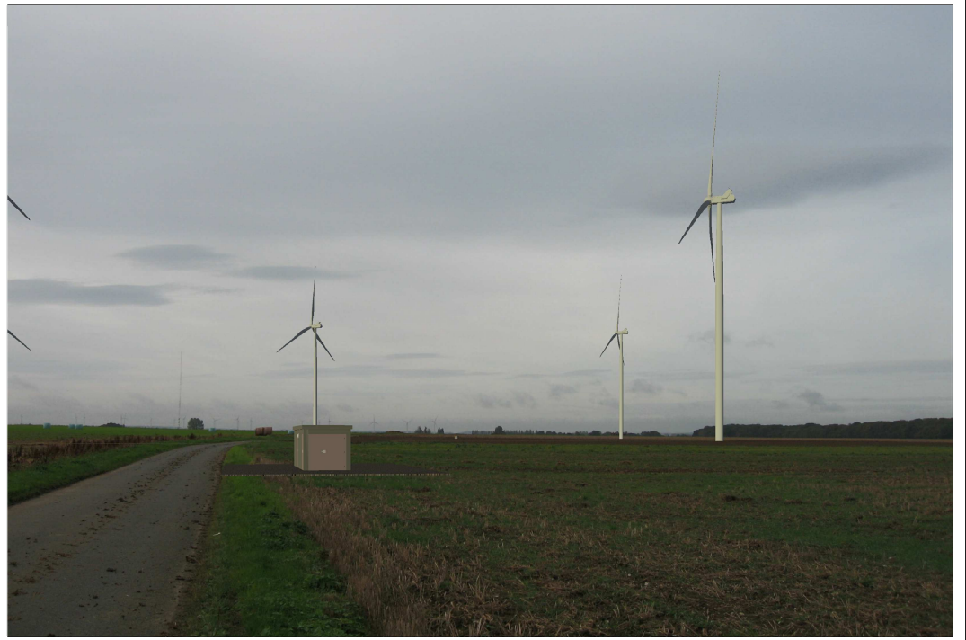
Poste de livraison n°2 : Vue après implantation