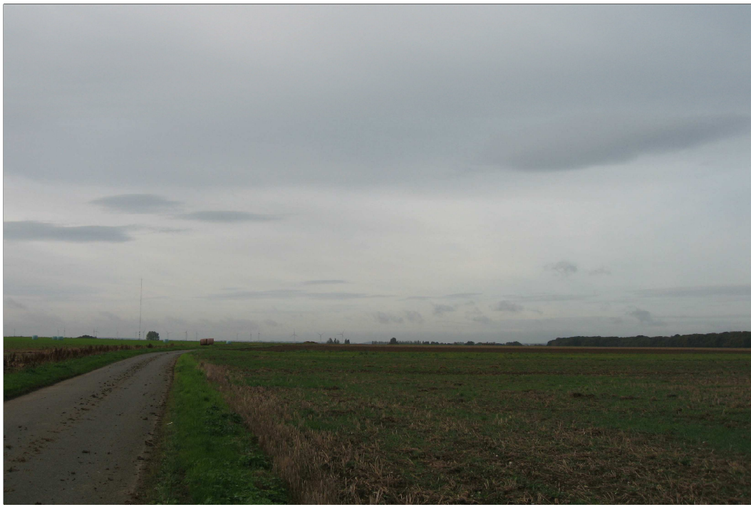
Poste de livraison n°2 : Vue avant implantation